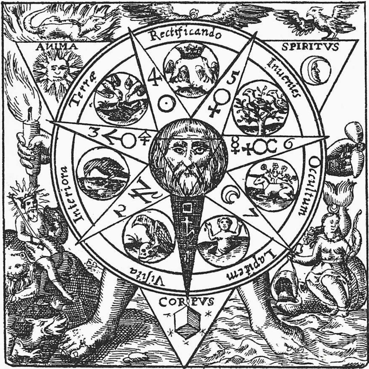
LE V.I.T.R.I.O.L DE BASILE VALENTIN

Il n'est pas de propos ici de faire une leçon d'alchimie, car cette voie ne se transmet qu'oralement (de plus mes connaissances étant limitées) et c'est très bien ainsi.